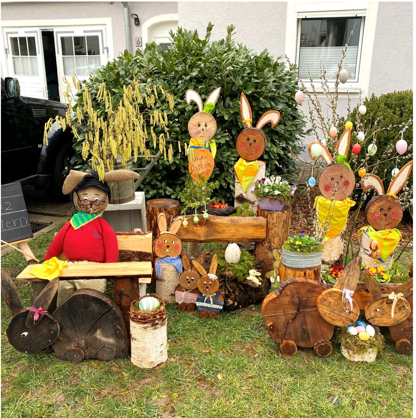
Die Osterhasenschule in der Rosenbacher Straße