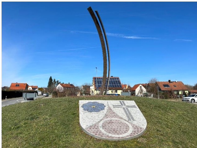
Die Neue Skulptur wie sie jetzt am Kreisverkehr steht

Die 7 m hohe, in sich geschwungene Skulptur ragt in die Höhe, beflügelt die Gedanken und katapultiert Energie ganz natürlich nach vorne. Sie fesselt den Blick, selbstbewusst aber ohne jegliche Arroganz. Durch ihre Zweiteiligkeit symbolisiert sie einen Teamgedanken, ein Miteinander. Die beiden Teile der Skulptur bedingen einander, reagieren und unterstützen einander, so das Atelier Röthel.