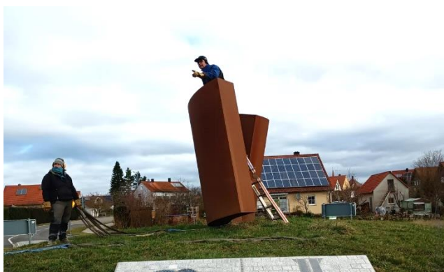
Thomas Röthel auf der alten Skulptur vor dem Abbau

Mal die Skulptur am Kreisverkehr ausgetauscht. Der Mitteldachstetter Künstler Thomas Röthel, der aus Wippenau stammt, stellt dem Markt Flachslanden die Skulpturen im mehrjährigen Wechsel kostenlos zur Verfügung, bevor sie dann an ihren endgültigen Standort verbracht werden. Der Bauhof und die FFW Flachslanden halfen dabei, dass der Austausch, des knapp 9 Tonnen schweren Kunstwerks, reibungslos vonstattenging.