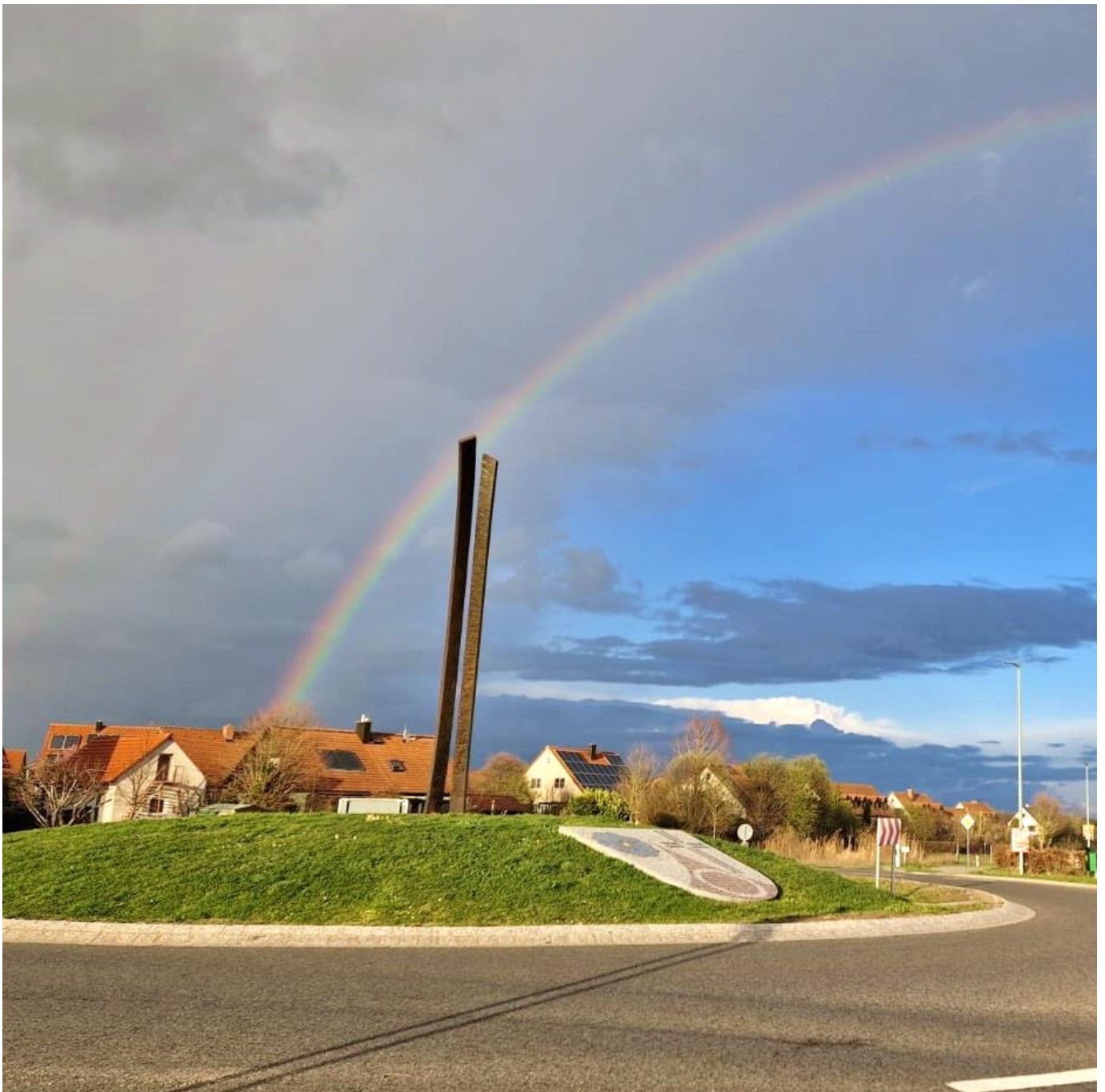
Regenbogen über der neuen Skulptur am Kreisverkehr.