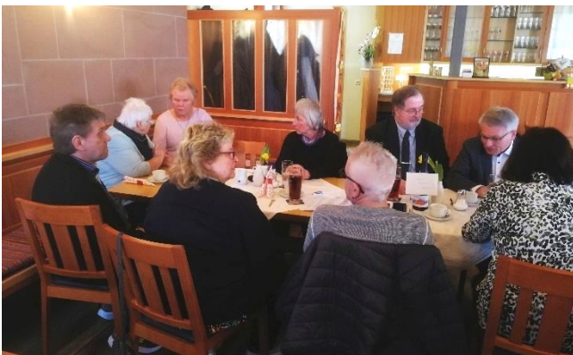
Vorstand, Jubilare & Gäste