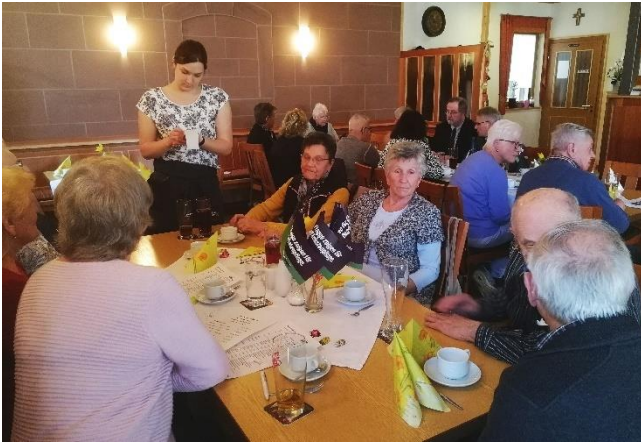
„Geselliges Beisammensein“