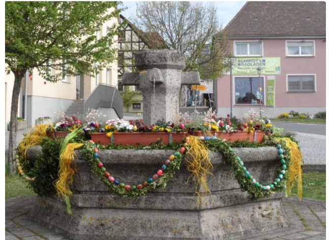
Der Osterbrunnen am Marktplatz in diesem Jahr