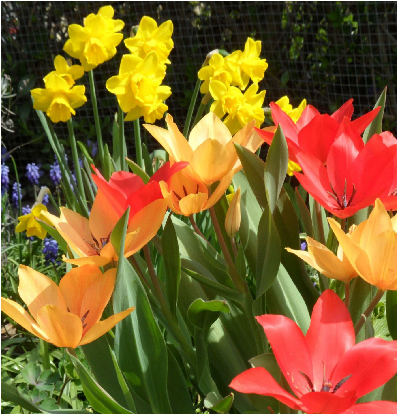
Frühlingsbild aus einem Garten in Flachslanden