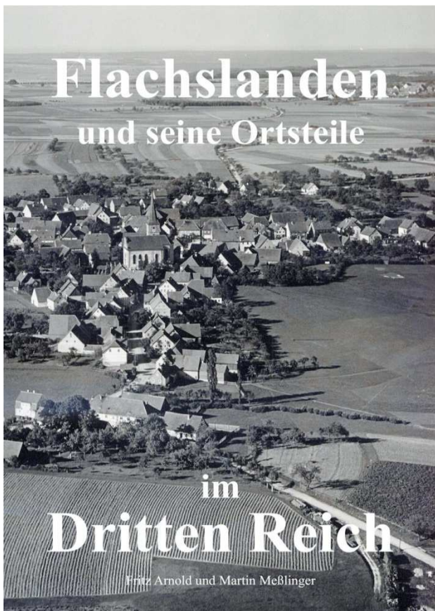
Titelseite des Buches

Der 16. April ist ein Jahrestag, den die älteren Bürger von Flachslanden und dem Gemeindeteil Virnsberg mit schrecklichen Erinnerungen verbinden. Am Montag, 16. April 1945, haben amerikanische Truppen von Oberaltenbernheim und dem Hörhof kommend das Gebiet der Gemeinde Flachslanden er-