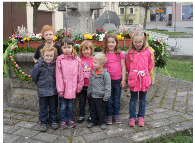
Die fleißigen Helferinnen und Helfer nach der Arbeit

Ich denke, es ist ein schöner, bunter Anblick, wenn man in der Hetze des Alltags vorbeigeht oder -fährt. Manche "kleinen Künstler" erkennen ihre Werke wieder und freuen sich dann, wenn sie z. B. sagen können: "Mama, schau, dies Ei hab ich bemalt".