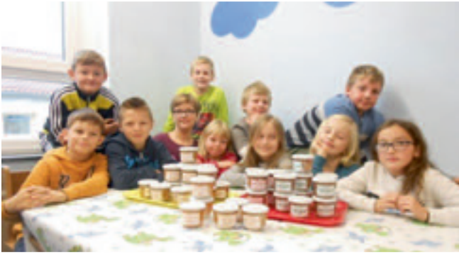
Unsere Viertklässler nach dem Marmeladekochen