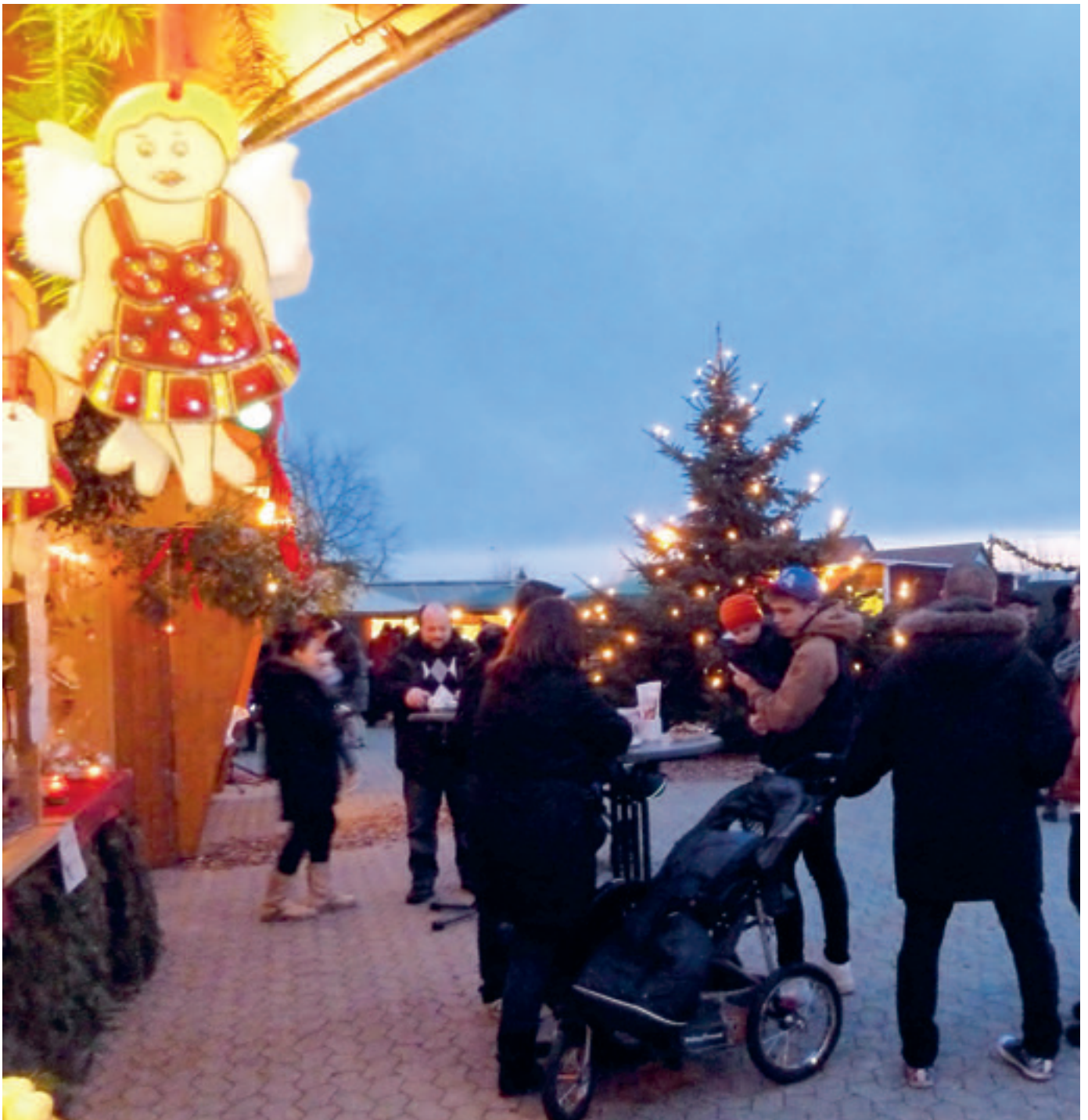
Weihnachtsmarkt in Flachslanden