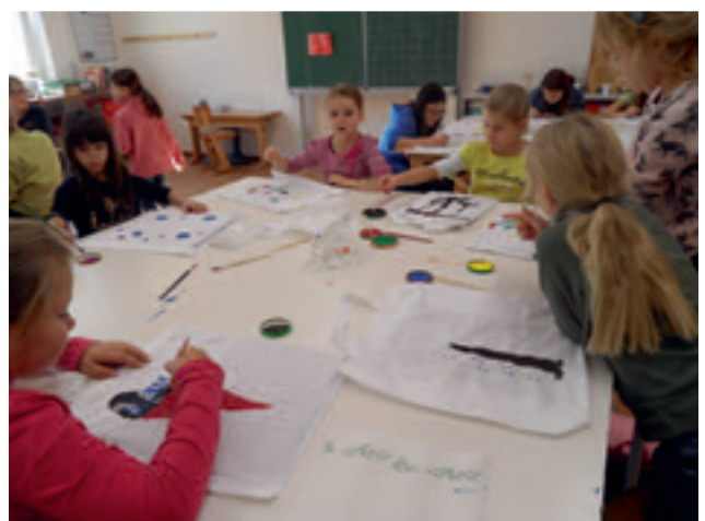
Unsere Ferienspaßkinder beim Bemalen der Stofftaschen

Um auf immer mehr unnötigen Verbrauch von Plastiktüten hinzuweisen, bauten und schraubten ca. 25 Kinder einen Taschenbaum und bemalten fleißig Baumwolltaschen mit tollen Motiven.