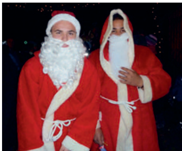
Der Weihnachtsmann kommt bei uns gleich doppelt

In diesem Jahr sind zehn Vereine aus unserer Gemeinde mit ihren Buden auf unserem Weihnachtsmarkt vertreten. Es erwarten Sie die Angelfreunde, der CVJM, die FFW Flachslanden, die Hegegemeinschaft Flachslanden, der Heimatverein, der Imkerverein, der Reitverein Hufeisen, der Schützenverein Flachslanden, der Partnerschaftsverein Flachslanden - Cornil/ Sainte-Fortunade und der Verein für Gartenbau und Landespflege mit folgendem Programm: