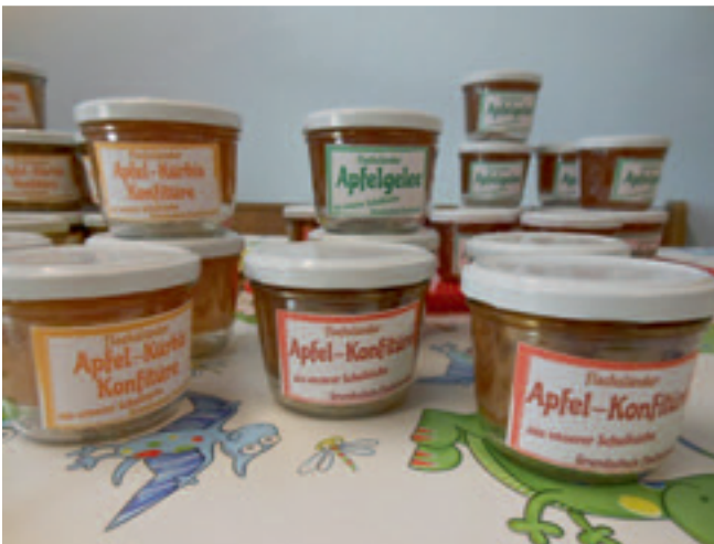
Und hier die Köstlichkeiten im Großformat