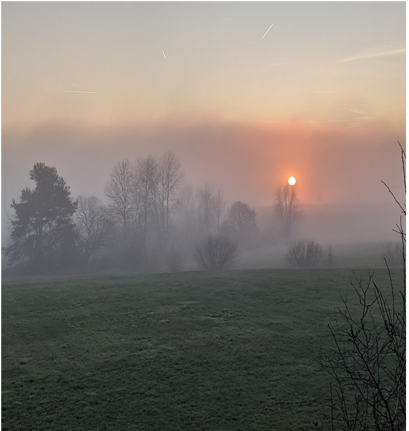
Winterlicher Sonnenuntergang am Rosenbacher Weiher.