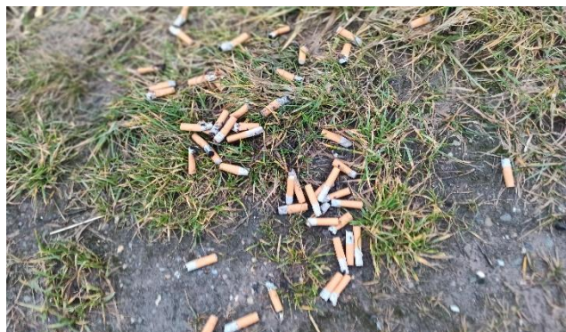
Zigarettenstummel am Kellerholz

Es gibt Mülleimer, Altglascontainer und die Rücknahme von Pfandflaschen. Doch manchen Raucher und Trinker schert das nicht. So wurde jetzt nahe des Kellerholzes ein übervoller Aschenbecher am Straßenrand ausgelehrt und im Wald zwischen Kettenhöfstetten und Borsbach warfen Unbekannte eine größere Anzahl von Weinschorle-Flaschen an den