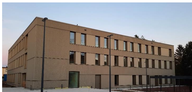
Das neue Gebäude in der Mariusstraße 26 in Ansbach

Nach 3-jähriger Bauzeit wird das neue Amt für Ernährung, Landwirtschaft und Forsten in Ansbach im März dieses Jahres bezogen. Vorbei ist damit auch die Zeit der Interimsquartiere und einiger Außenstellen des Amtes. Der überwiegende Teil der Mitarbeiter wird künftig am alten Standort in einem neuen größeren Gebäude zusammenziehen. Die Planungen zum Amtsneubau begannen im Jahr 2015. Im Januar 2018 wurde das alte Gebäude abgerissen. Der Spatenstich durch Staatsministerin Michaela Kaniber fand am 09. Mai 2018 statt. Noch sind Restarbeiten zu erledigen. Doch in der zweiten Märzwoche soll alles fertig sein und der Umzug stattfinden. Wir bitten um Verständnis, wenn die Mitarbeiter in dieser Phase kurzfristig nicht erreichbar sind.