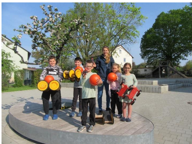
Das Team des Schulfördervereins