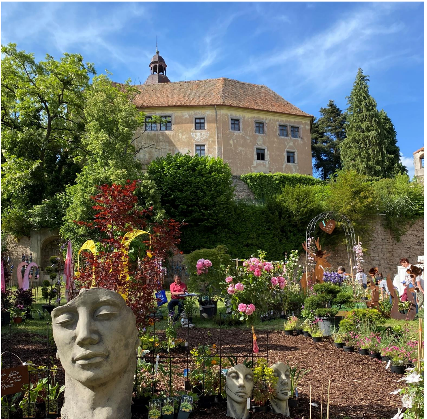
LebensArt 2022 auf Schloss Virnsberg – ein toller Erfolg; Foto: Hans Henninger