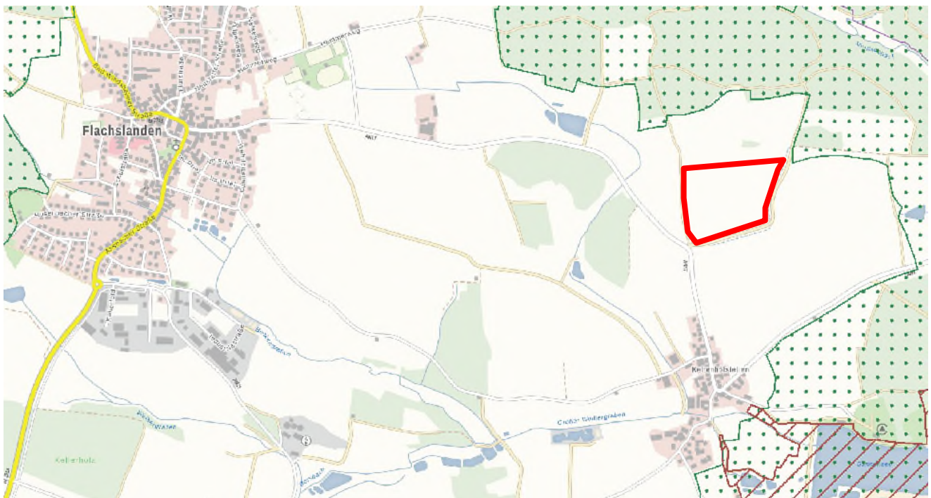
Abb. 1: Landschaftsschutzgebiete (Bayernatlas)

(Z) Die bestehenden Landschaftsschutzgebiete innerhalb der Region sollen langfristig in ihrem Bestand gesichert werden. Daneben sollen als Landschaftsschutzgebiete insbesondere Landschaftsteile gesichert werden, die zur Erhaltung und Entwicklung eines regionalen Biotopverbundes zwischen den Kernlebensräumen notwendig sind, die der Entwicklung neuer großflächiger naturnaher Lebensräume dienen und die als Erholungslandschaften und Landschaften mit außergewöhnlichem Erscheinungsbild besonders bedeutsam sind.