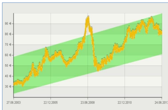
Ölpreis von Juni 2003 bis Juni 2013

Schlagen Sie den Ölpreisen ein Schnippchen, sichern Sie sich bequeme und günstige Wärme für die Zukunft!