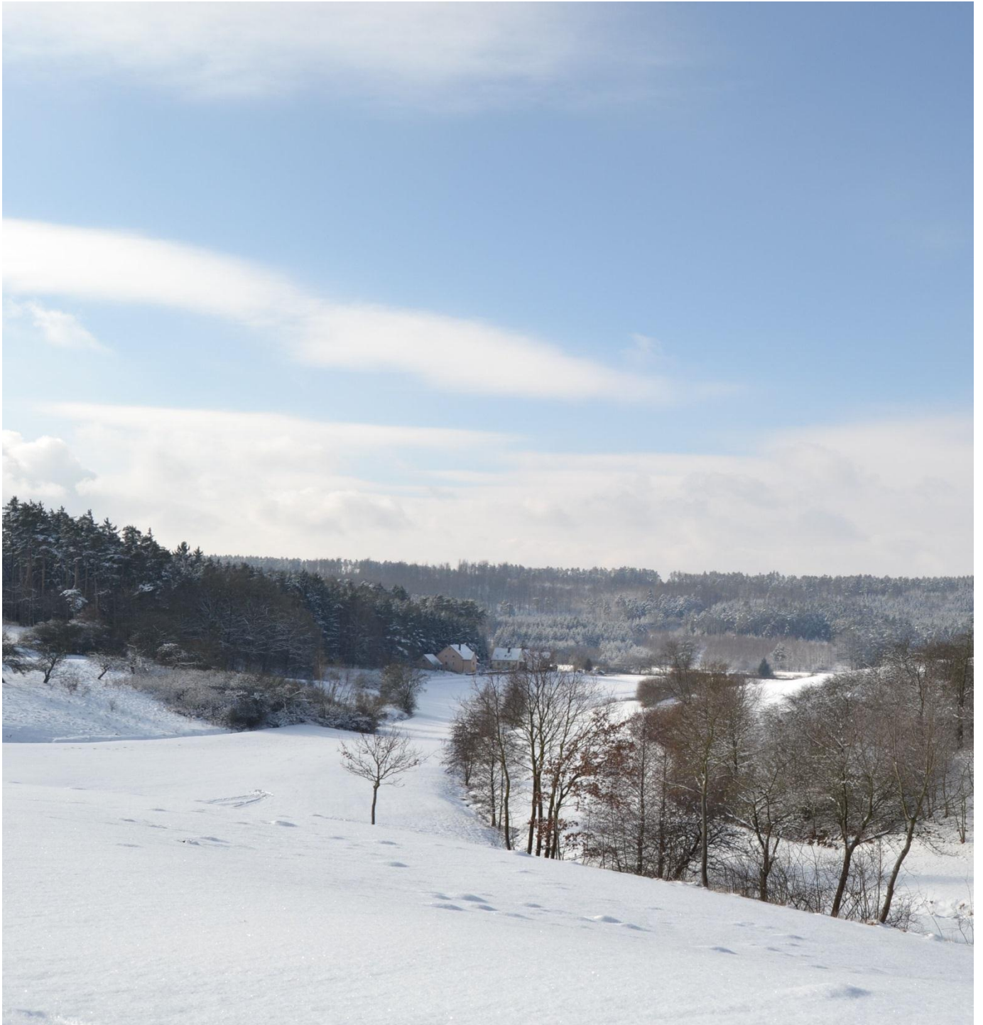
Blick von Oberrosenbach nach Unterrosenbach im Winter