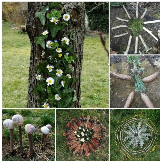
Landart der Klasse 1/2a - entstanden während des Lernens zu Hause

Sommerferien der Unterricht für alle Kinder begonnen. Leider müssen wir aber nach wie vor Präsenzunterricht mit „Lernen daheim“ verzahnen. Das bedeutet, dass im Wechsel unsere Zweit- und Drittklässler und dann unsere Erst- und Viertklässler an der Schule unterrichtet werden. Für unsere gesamte Schulfamilie ist dies dennoch ein großer Schritt. Es tut gut, sich wieder persönlich zu sehen, sich auszutauschen und gemeinsam durch diese wirklich nicht einfache Zeit zu gehen.